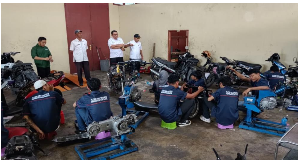
Pelaksanaan Kegiatan Pelatihan Teknisi Sepeda Motor untuk 16 orang pencari kerja di Kabupaten Lima Puluh Kota

Selain itu Bidang Ketenaga Kerjaan juga melaksanakan pelatihan kewirausahaan kepada 32 orang pencari kerja di Kabupaten Lima Puluh Kota yang terdata pada data P3KE