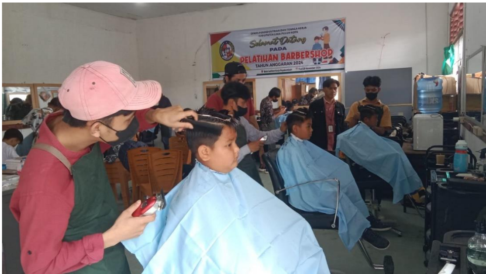
Pelaksanaan Kegiatan Pelatihan Barber Shop untuk 16 orang pencari kerja di Kabupaten Lima Puluh Kota