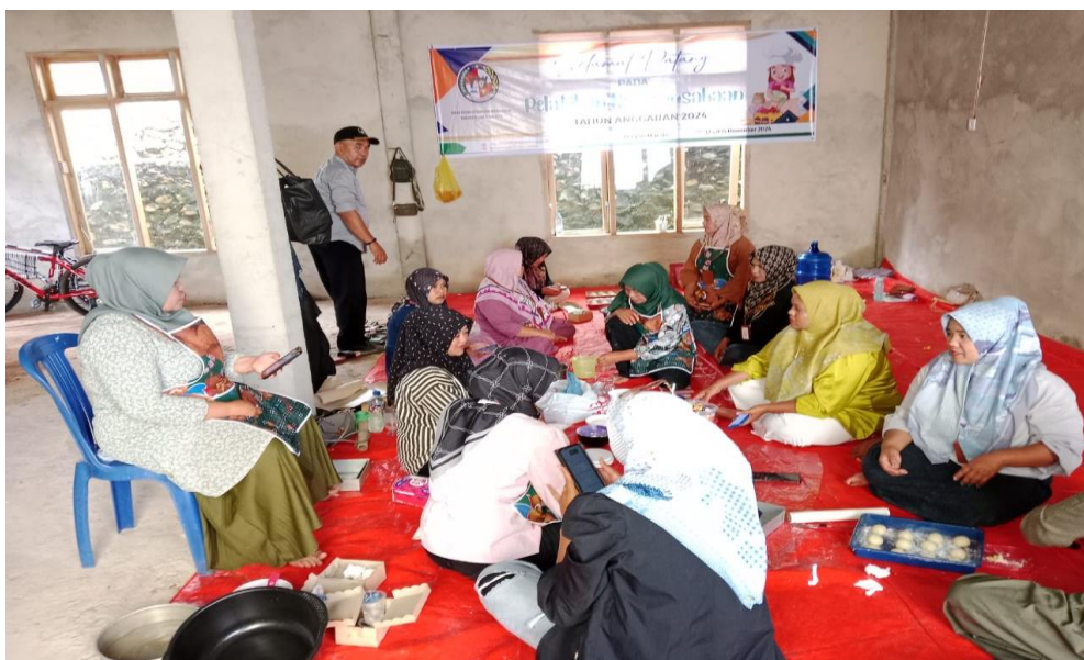
Pelatihan kewirausahaan untuk 32 orang pencari kerja yang terdata pada data P3KE