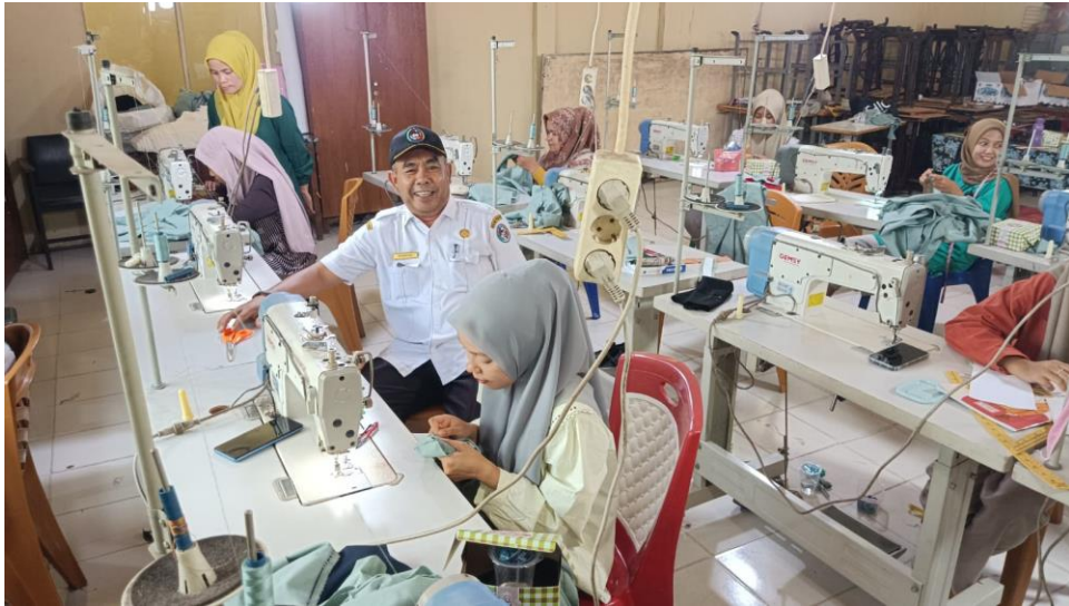
Pelaksanaan Kegiatan Pelatihan menjatih untuk 16 orang pencari kerja di Kabupaten Lima Puluh Kota